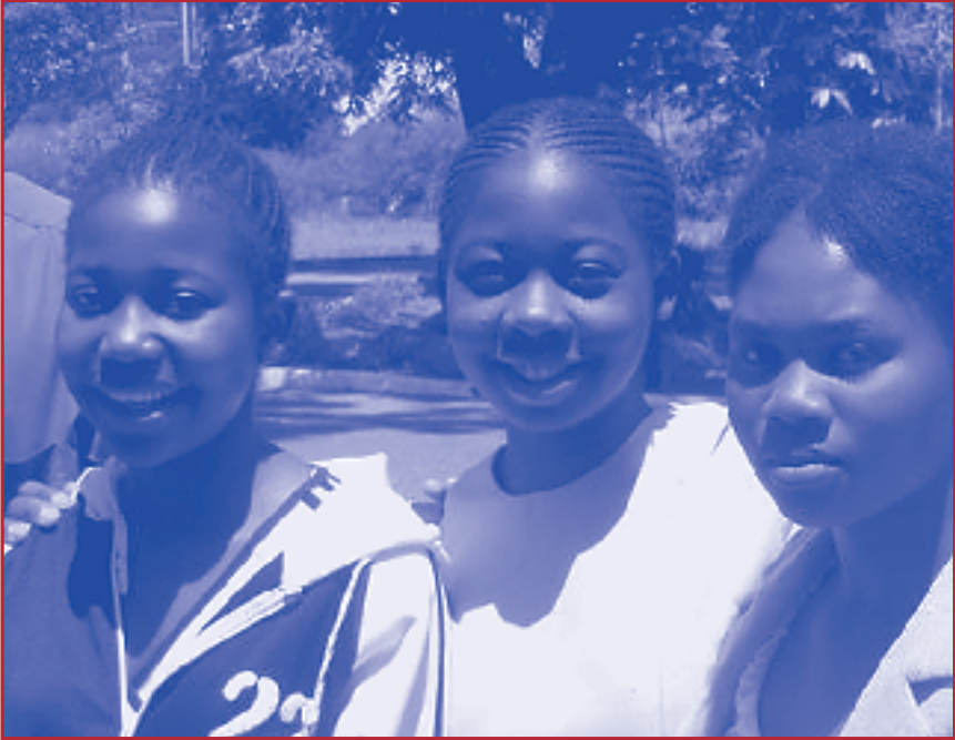
Participantes al curso

bargo, al explicar que los alumnos no venían a investigar a los funcionarios públicos, sino a expulsar el mal de la corrupción, tal como ellos lo veían, ayudó a calmar dicha hostilidad.